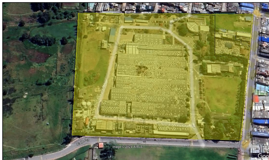
Ilustración 1. Ubicación de predios