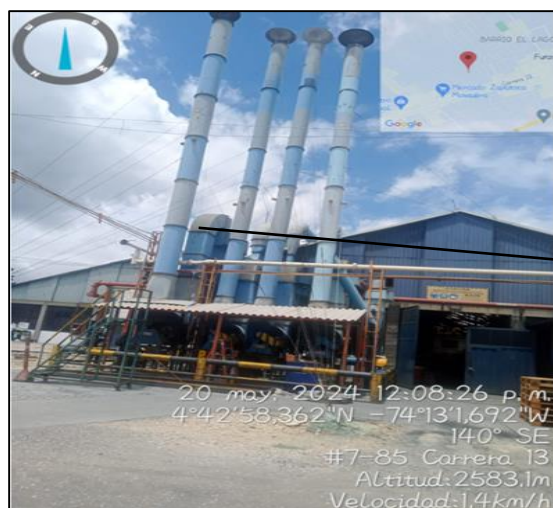
Ilustración 4. Chimeneas exteriores proceso de fundición

En las coordenadas 4°42'58,362" N y 74°13'1,692" W se encuentra ubicado el proceso de fundición, en esta área se observan cuatro chimeneas exteriores con las siguientes alturas: 1 chimenea con una altura de 15,27 mts correspondiente al horno fusor y tres de 15 mts, estas cuatro chimeneas funcionan a base de electricidad, cuentan con plan de contingencia y sistema de control ambiental correspondiente a ciclones, igualmente, al interior del proceso se observa chimenea, que corresponde al horno secado de viruta, el cual funciona con combustible a base de GLP. (De esta chimenea no se toma registro fotográfico a solicitud de la ingeniera Laura Ariza por políticas de confidencialidad del proceso)