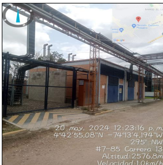
Ilustración 7. Planta Eléctrica

Ubicada en las coordenadas 4^{\circ}42'54,972'' N y 74^{\circ}13'4.8'' W donde se observan 4 ductos, cuyo funcionamiento es a base de ACPM, no se tienen datos de altura de las chimeneas, se manifiesta que la planta se activa de manera manual cuando se presentan cortes de energía de la red de ENEL. Se aclara en este punto que la planta no hace parte de un proceso continuo de la planta.