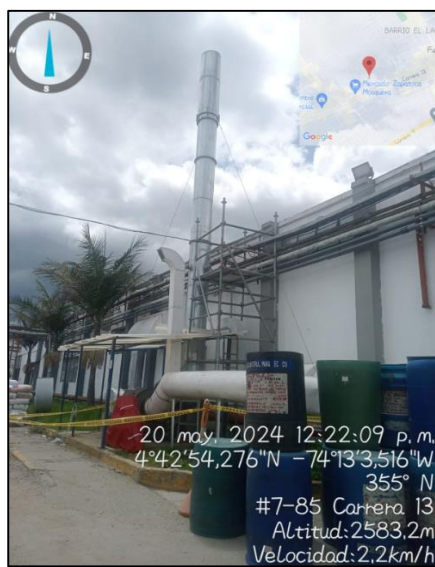
Ilustración 6. Chimenea proceso de pintura

Área de pinturas donde se identifica chimenea en las coordenadas 4^{\circ}42'54,276'' N y 74^{\circ}13'3.516'' W altura de la chimenea 11mts.