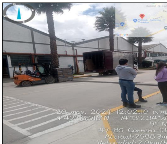
Ilustración 3. Inicio de recorrido

En la visita técnica se realiza inspección al interior de la empresa con acompañamiento de la coordinadora ambiental, iniciando en las coordenadas 4°42'53,016" N y 74°13'2,34" W, a quien se le informa el motivo de la visita.