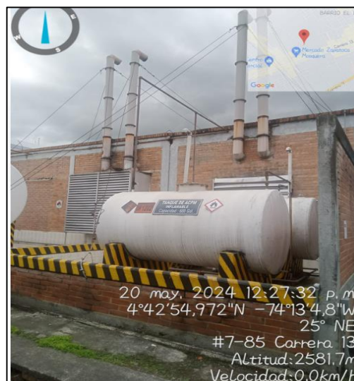
Ilustración 7. Chimeneas Planta Eléctrica